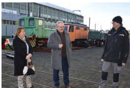
Das aus der Alten Dreherei führende Straßenbahngleis muss noch ans Netz der Ruhrbahn angeschlossen werden