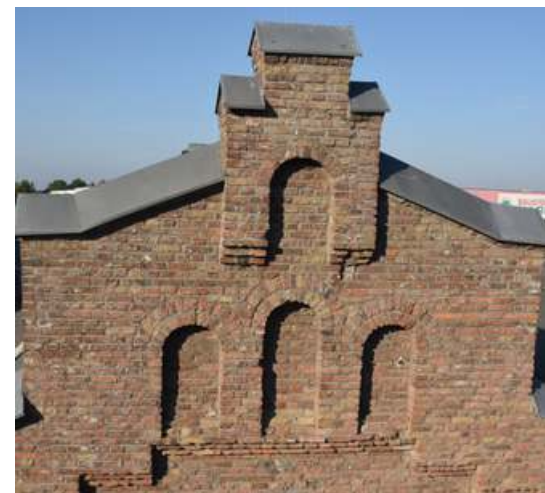
Mauerwerksdetail am Südgiebel

Wir Arbeiten jeden Dienstag, Donnerstag und Samstag von 10 bis 14 Uhr an der Alten Dreherei