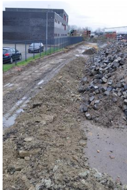
Bau des Verbindungsweges vom Wendehammer zum Radschnellweg

Leider finden aufgrund der fehlenden Heizungsanlage in den Wintermonaten keine Veranstaltungen statt. Auch unseren Trödelmarkt mussten wir ausfallen lassen, da insbesondere die Fußgänger nicht die Zufahrt über die Straße „Zur Alten Dreherei“ annehmen. Für Fußgänger und Radfahrer ist der Weg aber ab März wieder passierbar.