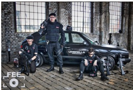
Ein Teil des bereits gepflasterten Ostschiffes steht für Film- und Fotoaufnahmen zu Verfügung

Aufgrund der fehlenden Heizung lässt sich die Alte Dreherei im Winter nur bedingt für Veranstaltungen nutzen. In letzter Zeit waren verschiedene Fotografen vor Ort, um Aufnahmen von Sportteams, Produktfotos oder Zombis zu machen. Von letzteren gibt es im Internet ( http://www.feenstaub-entertainment.de/index.php/nggallery/page/1?p=10748 ) viele Fotos zu sehen.