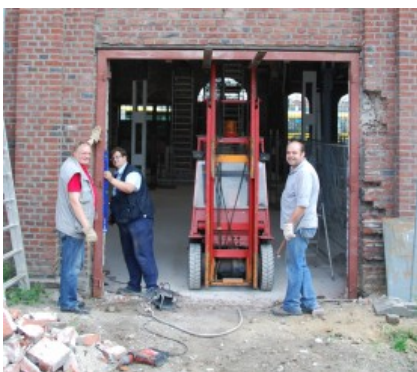
Hallentor eingebaut und die weitere Sanierung gestartet

Fast täglich waren unsere Mitglieder im Juli in der Alten Dreherei oder auf Veranstaltungen aktiv. Neben der anstrengenden Sanierung gab es aber auch entspannende Momente in historischer Umgebung.