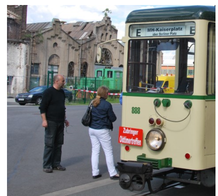
Für Oldtimer-Straßenbahnen wurde die Sonderhaltestelle „Alte Dreherei“ eingerichtet