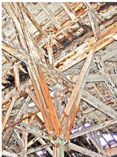
Die einzigartige Holzkonstruktion von 1874 will der Trägerverein erhalten

zentrum, eine vielseitige Ausstellungshalle und ein technisches Museum in einem Gebäude nahe der Innenstadt entstehen. Was mit bürgerschaftlichem Engagement möglich ist, zeigt z. B. die Erhaltung des Mülheimer Schloss Broich, das sich durch besondere Events, wie das Castle Rock-Festival oder die Schloss Weihnacht einen Namen gemacht hat. In Duisburg ist ähnliches mit dem Landschaftspark Duisburg-Nord gelungen, der heute ein gut besuchter Tourismusort ist.