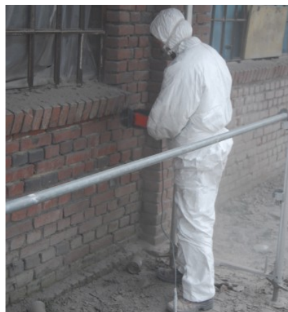
Trägerverein Haus der Vereine in der Alten Dreherei e.V. Am Schloß Broich 50, 45479 Mülheim

Derzeit arbeiten wir am neuen südlichen Hallentor, an der Holzkonstruktion, an den Metall-Fensterrahmen, bereiten den Wasser- und Abwasseranschluss vor, haben die Fügen im nördlichen Hallenteil gereinigt und werden diese demnächst verfugen.